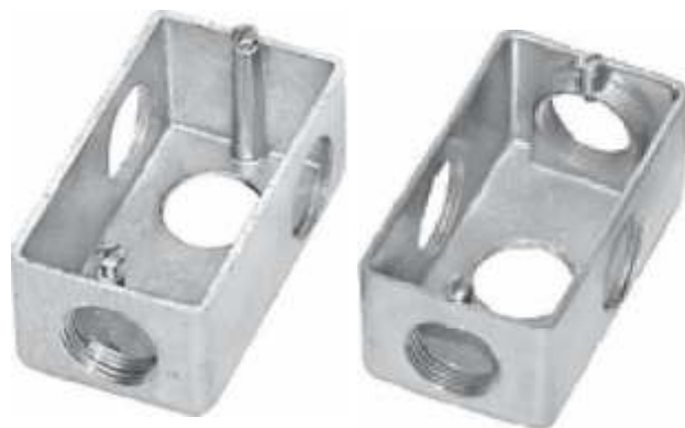
Esquema das possibilidades das entradas

Acabamento padrão em Alumínio natural, e com pintura eletrostática na cor cinza.